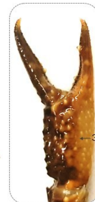
Spody szczypiec barwy cielistej, żółtawej lub zielonkawej